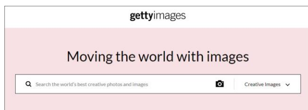
Getty Images 网站截图

美国科技媒体网站 Ars Technica 称，Getty Images 因积极对所谓违法出版物追究其主张的授权费而“出名”。