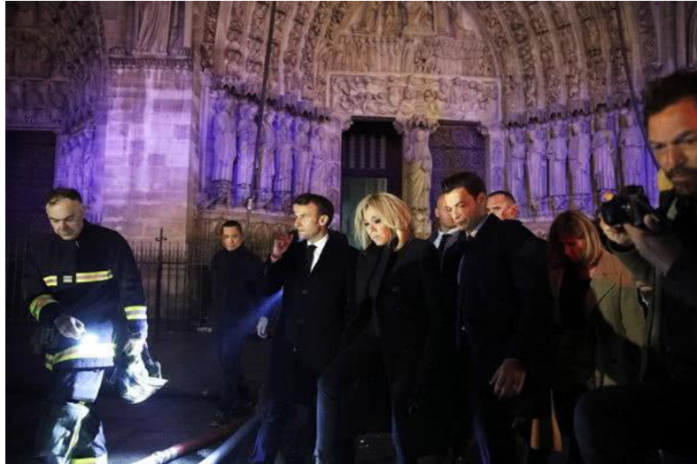
当地时间 2019 年 4 月 15 日，法国巴黎，法国巴黎著名地标巴黎圣母院起火，法国总统马克龙视察在巴黎圣母院内部视察灾情。