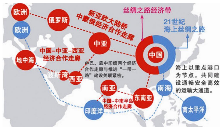
一带一路发展示意图

首先我们得承认在全球化进程中中国是一个后来者，所以我们的经验、认识还不是最充分的。从客观上讲我们中国在全球化过程中的获益是非常非常多的。从地理大发现到现在的500年，西方国家基本上都是全球化的推动者，但是他们也有问题，就是他们全球化的利益分配上总是出问题，一旦利益分配有问题就会爆发战争和冲突，某种意义上讲，一战二战都属于西方推动的全球化不平衡的产物。