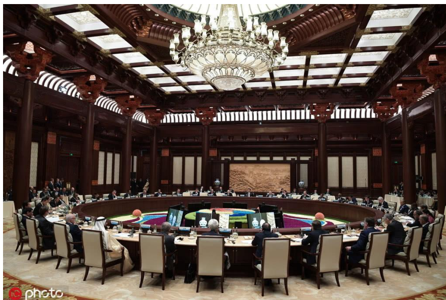
“一带一路”圆桌峰会现场

现在要说变化，四个理由都还在，只是目前来看，美国对我们的压力更大了，中国就需要新的国际空间，从这个角度来讲，第一个目的还是有的。第二个我们依然有输出产能的需要：虽然这两年国内供给侧改革调整了产能布局，但实际上产能往外走仍然是一个选择。平衡内部发展的作用也还在。