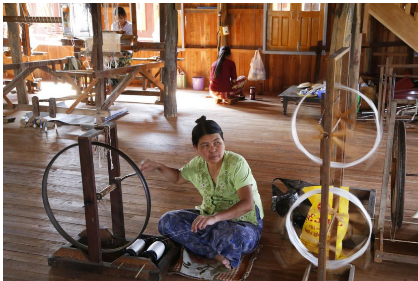
缅甸手工业劳动者

该来的肯定是会来的。美国和有些国家光说不练不一样，一旦重视了这个国家的行动能力是很强的。这一点我们要要有心理准备。