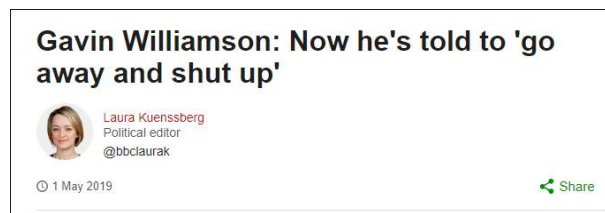
BBC: 威廉姆森被告知“走开并闭嘴”

不过，威廉姆森依旧不认账。他拒绝主动辞职，不愿被当成自己“认罪”了。在给特蕾莎·梅的回信中，他称自己相信“彻底和正式的调查”会证明自己的立场。