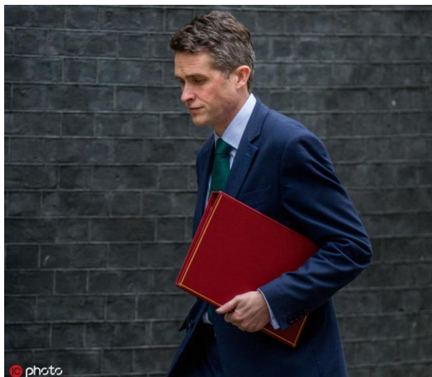
加文·威廉姆森

当地时间5月1日，特蕾莎·梅宣布解雇国防大臣加文·威廉姆森，也即认定他就是那个泄密的“内鬼”。