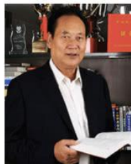
步长脑心通发明人 赵步长

赵步长，男，汉族，1963年毕业于西安医科大学医疗专业。1973年加入中国共产党。全国人大代表，著名心血管病专家，著名药物发明家，国务院有突出贡献专家，西安交大硕士生导师。优秀共产党员、社会主义建设者、“脑心同治”理论创立者，“脑心同治”专业委员会主任委员。陕西省十大发明人之一，陕西省功勋企业家，美国中华医学会高级顾问，中国老年保健协会高级顾问，中国中西医结合学会常务理事，2018年获评“纪念改革开放四十年医药功勋人物”，“金叶奖·中国医药终身成就奖”。赵步长教授一直从事心脑血管病的临床研究和医学教育工作。他潜心研究了“药气针、钻颅抽血、颈动脉灌注”三大技术，并以此为基础研制成名牌产品“步长脑心通”、“丹红注射液”、“步长稳心颗粒”等著名心脑血管病药物。