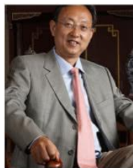
步长制药董事长 赵涛

赵步长，男，汉族，1963年毕业于西安医科大学医疗专业。1973年加入中国共产党。全国人大代表，著名心血管病专家，著名药物发明家，国务院有突出贡献专家，西安交大硕士生导师。优秀共产党员、社会主义建设者、“脑心同治”理论创立者，“脑心同治”专业委员会主任委员。陕西省十大发明人之一，陕西省功勋企业家，美国中华医学会高级顾问，中国老年保健协会高级顾问，中国中西医结合学会常务理事，2018年获评“纪念改革开放四十年医药功勋人物”，“金叶奖·中国医药终身成就奖”。赵步长教授一直从事心脑血管病的临床研究和医学教育工作。他潜心研究了“药气针、钻颅抽血、颈动脉灌注”三大技术，并以此为基础研制成名牌产品“步长脑心通”、“丹红注射液”、“步长稳心颗粒”等著名心脑血管病药物。