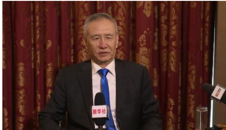
国务院副总理刘鹤在第十一轮中美贸易磋商结束后接受媒体联合访问

也许我们先前的考量是就让特朗普蒙在鼓里，在关税层面和他耗，但如果他一旦搞清楚了，知道关税是怎么回事了，会不会改用其他对中方更不利的方法施压，比如打南海牌、台湾牌？不过，他能打的牌任何时候都能打，而我们也不必在贸易上与自己过不去。与其担心美国在南海、台湾等议题上制造事端，不如直接思考相关应对措施，尽量减少在中美贸易摩擦中卷入其他不必要的影响因子。