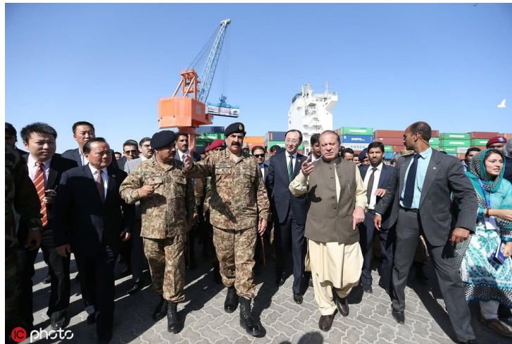
瓜达尔港开航

过去四十多年的改革开放，就是把整个中华文明推入国际大竞争，看一看中华文明能不能站住脚。结果发现，中华文明不但站住了脚，经受了考验，我们文明的很多内容还被迅速激活。我们通过取长补短、兼容并蓄，促使中国成了世界上进步最快、活力最大的国家。可以说，中国是一个“天降大任”的国家，它应该承担起自己对于人类和世界的责任，特别是与各国人民一起去构建一个更加和平、公正和繁荣的世界新秩序。