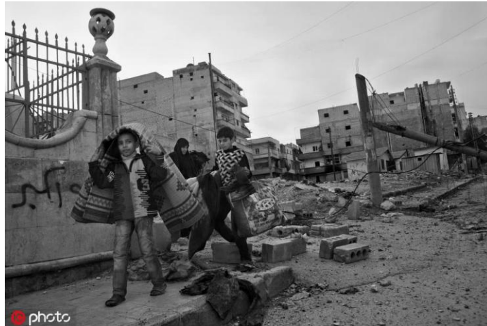
“阿拉伯之春”在叙利亚

当然，梁启超之后的中国变了，世界也变了。但是在某种意义上看，西方唯我独尊、损人利己、“零和游戏”的思维方式迄今也没有大的改变：西方主要国家还会以推动“普世价值”的名义，把自己的意志强加于人，推动所谓的“颜色革命”和“阿拉伯之春”，甚至不惜发动战争，这一切使许多国家和地区陷入了动荡战乱，生灵涂炭。