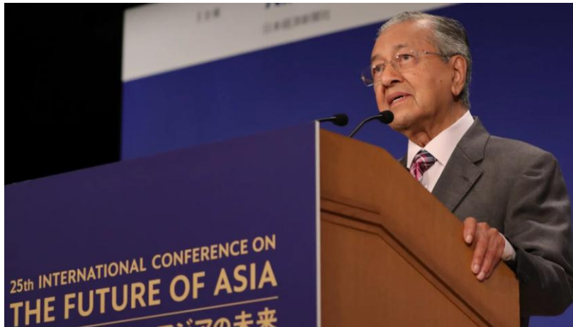
马哈蒂尔在“亚洲未来”会议上

在30日举行的“亚洲未来”会议上，有记者提问马蒂哈尔，马来西亚是否会遵循美国的脚步，对华为实行禁令。