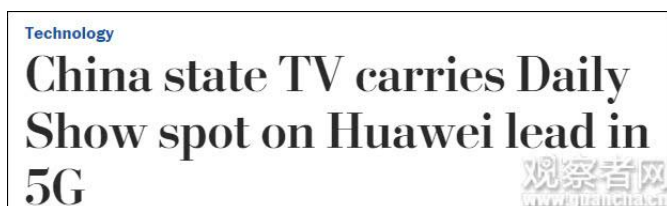
《华盛顿邮报》报道截图