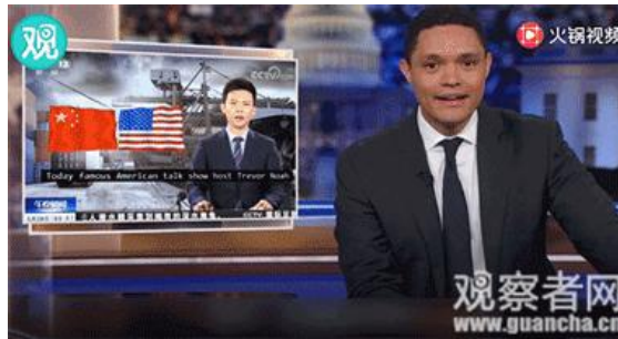
视频截图 视频/观察者网 张逸清

这段脱口秀获得央视报道后，别名“崔娃”的特雷弗还在新一期节目中兴奋大喊：“宝贝，中国报道我了！”