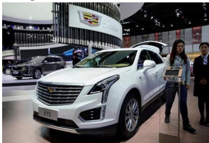
A Cadillac XT5 at media day for the Shanghai auto show in April. Chinese consumers have helped Cadillac reach its highest global sales mark.