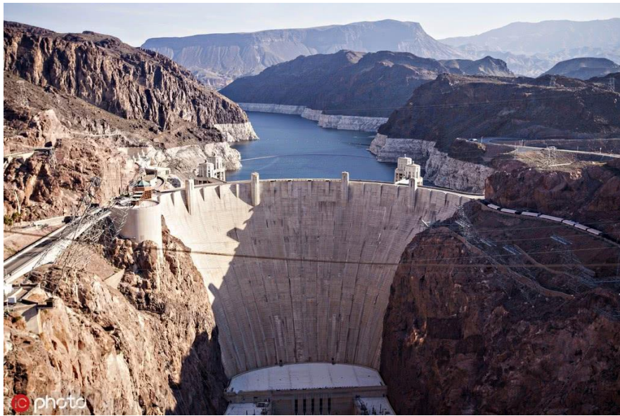
胡佛大坝

确实，李鹏也利用这个机会鼓励美国加大对华投资，以及必要的技术转让。在这四天里边，我们先后考察了芝加哥商品交易所、福特汽车公司、密西西比河的航运系统、胡佛大坝、兰德中心，我们访问了硅谷，我们去了斯坦福大学，了解他们产学研结合的状况。当时李鹏也主管教育，所以李鹏一路走，兴致勃勃，不停地提问题，不停地记笔记。他也说，美国有很多经验是值得中国借鉴的。