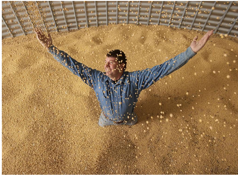
美国大豆

鞋类协会、美国消费者技术协会等等都在控诉，说提高关税只会惩罚美国的农民、美国的企业、美国的消费者。这使我想起一句哈萨克斯坦谚语，叫做“吹灭别人的灯，会烧掉自己的胡子。”