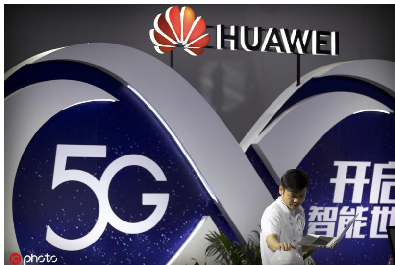
为封锁华为，特朗普宣布国家进入紧急状态

而在移动互联网方面，特别在移动互联网的应用方面，应该说中国已经走在美国的前面了。如果没有记错的话，去年中国的移动支付总额已经是美国的 90 倍。确实只有中国一个国家做到了“一部手机，全部搞定”。这一次美国对中国华为公司崛起所产生的恐惧，很能说明问题。坦率地讲，一个中国的民营公司，能够使美国总统宣布国家进入紧急状态，这个事实本身确实令人回味无穷。