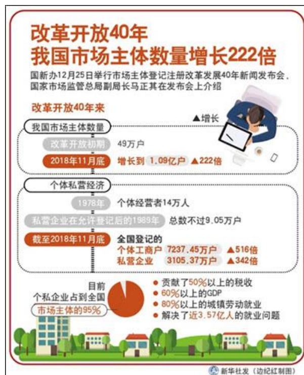
改革开放 40 年，我国市场主体数量增长 222 倍（@新华社）

所谓奇迹，就是不能用现有理论解释的现象。如果用西方经济学理论来看中国，到处是问题，只要中国经济增长稍微放慢一点，国际学界和舆论界就会出现“中国崩溃论”。但实际上，中国经济不仅没有崩溃，还一直保持稳定快速发展，而且也不曾出现过系统性经济金融危机。