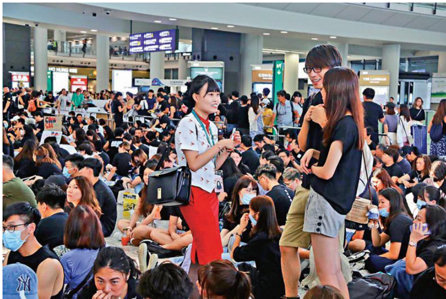
8 月 12 日出现在机场“示威”现场支持“示威者”的国泰航空员工

在近期的香港动乱中，国泰航空内最为活跃的团体就是 CPFTU（国泰航空空服人员工会）。该工会自 7 月 21 日起就不断煽动在机场进行示威活动，更是积极组织成员参加 8.5 罢工，最终国泰航空有三千余名员工参加罢工。在民航局出台针对国泰的安全警示后，香港空服总工会（国泰集团成员占绝大多数）发表声明表示遗憾，坚称拥有游行与罢工的自由。近期以来的表现足以显示，国泰空服人员工会，甚至香港空勤人员总工会内充斥着不可靠的人员，成为煽动香港社会动乱的马前卒。