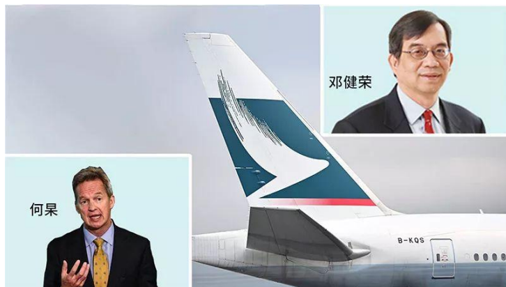
国泰航空宣布邓健荣将接替何杲出任行政总裁

而近期透露的消息表明，国泰航空的管理层后续还将进一步清理，符合我列举的第六条整改措施，可以说近期国泰航空及其母公司表现出了相当的“求生欲”。