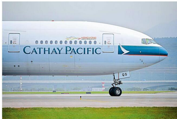
圖: 國泰繼去年在全球航空公司安全排名中「插水式」暴跌至第12位後, 今年再次十大不入, 排名第11位