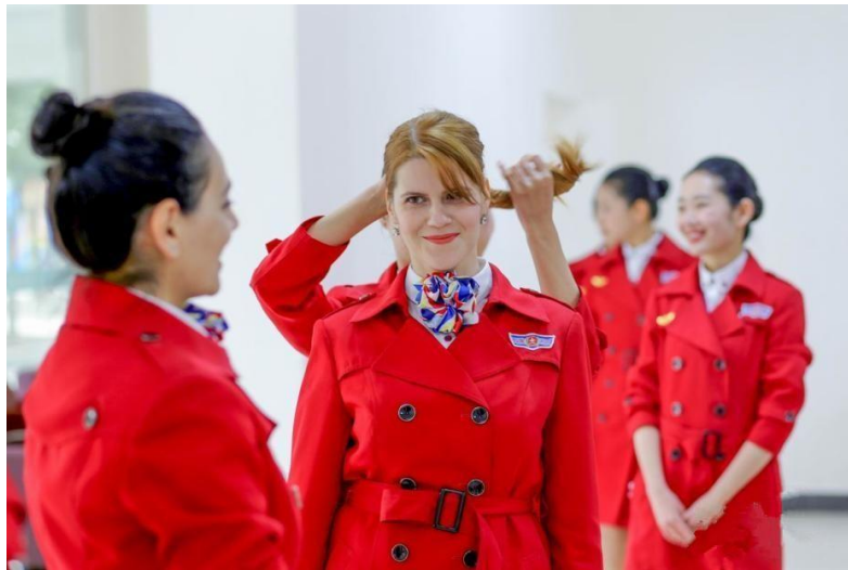
随着国内航空公司走向国际化，外籍空乘也早已不是新闻了

国泰航空空乘的平均工资只有 1 万 7 港币(约 1 万 4 人民币)，和香港收入中位数差不多，也和内地航空公司空乘平均工资差不多(约 1 万 5 人民币)，但若考虑到内地与香港巨大的物价差价和居住环境差距，来大陆航空公司工作可以说是一个极具可操作性的选择。毕竟外籍空乘在国内早就不是新鲜事了，笔者在 2013 年京沪航线上就已经看到过一个操着一口流利普通话的欧美金发空乘。而对于国泰的内地空乘来说，在国泰航空这个 skytrex 排名第四的公司内练出的一身服务水平，更是可以轻松胜任内地航司的空乘岗位。