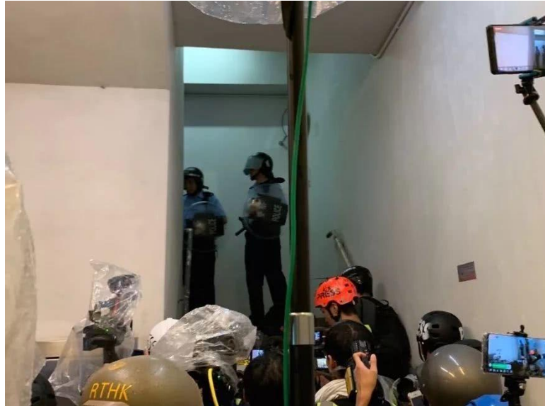
港警被记者围堵在一幢大厦内