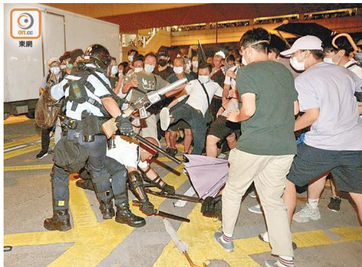
7月30日晚，警察被示威者围攻 图源：香港“东网”

其中一名警察挥舞警棍自卫，刘 Sir 则不得已举起手上的枪瞄准暴徒予以警告，才扭转危险局面。