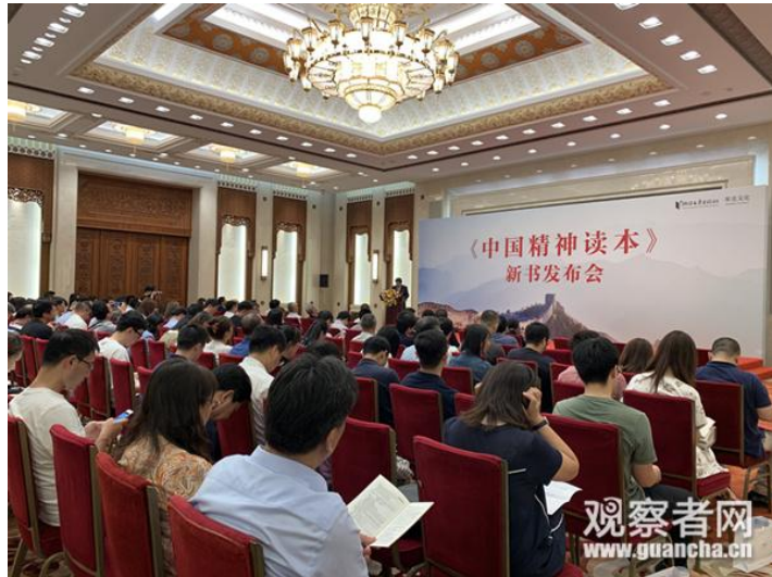
《中国精神读本》新书发布会现场