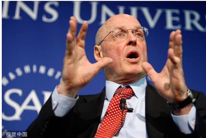
美国前财长保尔森

从当时中国的经济情况来看，外贸占经济总量的比例很高，其中中美贸易又占了很大一部分，所以美国金融海啸确实也给中国造成了巨大的消极影响。中国人真的认为，世界经济是你中有我，我中有你，谁也不能独善其身，也就是我们经常讲的一荣俱荣一损俱损。中国的文化基因也是如此，与人为善，同舟共济，互相帮助。所以中国政府经过慎重思考后，决定出手救美国，大量增持美国国债，同时自己也进入货币相对宽松时期，出台了后来有些争议的“4万亿”政策。但我认为，总体上“4万亿”还是利大于弊。毕竟我们用这4万亿让中国的基础设施得到全面提升，包括建成了世界最大最好的高铁网。