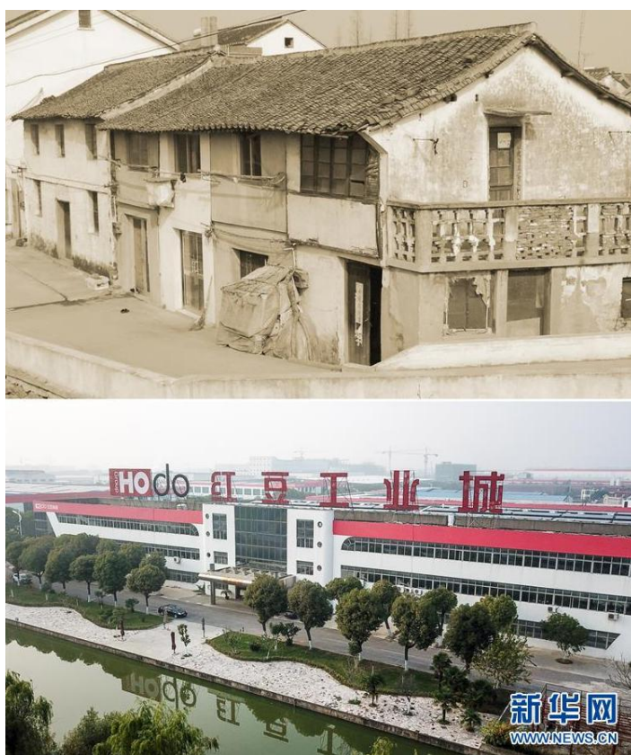
江苏无锡红豆集团，上面是1950年代老厂房旧址，下面是红豆集团工业城。

这个理论突破，形成了我们今天经常讲的两个不动摇：毫不动摇地巩固和发展公有制经济；毫不动摇地鼓励、支持、引导非公有制经济发展，坚持平等保护物权，形成各种所有制的经济平等竞争，互相促进的一种全新的格局。