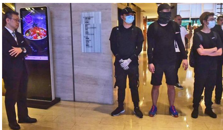
激进示威者一度闯入酒店大堂