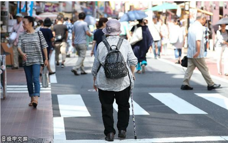
日本街头的老年人（资料图）

日本社会存在诸多不确定性，其中人口减少及老龄化问题对现代日本国家带来深刻威胁。现代国家构成由主权、领土以及国民构成，但最关键的“国民”却在不断减少。人口年龄中值大幅度提高，社会更加强调“安心，安全，安定”，社会改革乃至技术创新面临老龄化瓶颈。日本战后成功体验造成的径路依赖，束缚了年轻一代的创造欲望与发展空间。这种现实也深刻影响到日本民间亚洲认知。目前，日本存在亚洲认知严重滞后的现象。这些问题，均有待日本社会加以解决、突破。