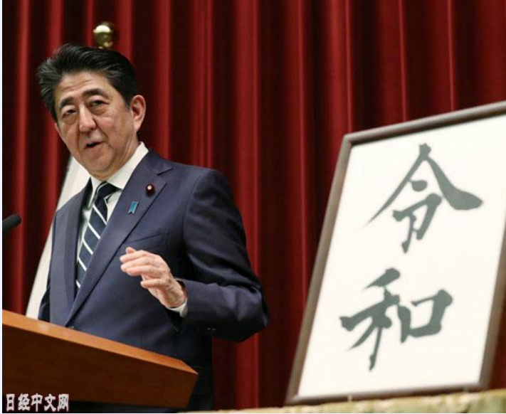
新年号“令和”发布后，日本首相安倍晋三发表谈话（4月1日，首相官邸）

面对世界大变局，日本有自己的“坚持”与“不变”。这种“坚持”“不变”，均是建立在日美同盟基础之上的政治信念。尽管日本政治外交界对特朗普政治外交心存疑惑，但至少在政府层面，日本并无迹象修正战后以来持续至今的这种制度。