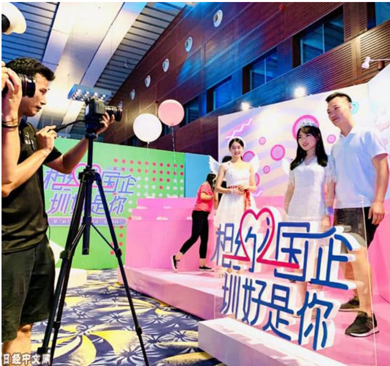
在深圳举行的相亲活动

在中国，活用互联网的相亲活动正在不断发展。除了推出利用 VR（虚拟现实）等的新服务以及利用区块链技术的个人信息保护对策之外，举行相亲聚会等活动的措施也在增加。一项调查显示，单身人士的 8 成使用婚恋网站，网上相亲活动已在中国社会扎根，在此背景下，预计市场规模到 2021 年增至 1000 亿日元。