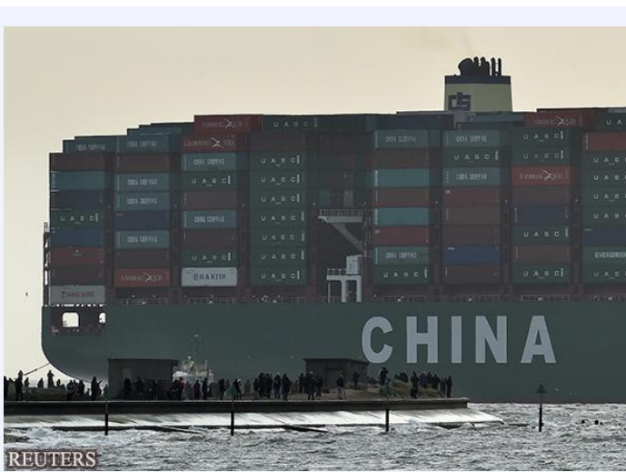
装满集装箱的中国货船

对日本企业来说，脱离邻近的世界第 2 大经济大国，也难以描绘经营战略。中日两国的外交关系已经好转。“如今郁金香正在盛开”，有日本外交相关人士以这样的比喻推动日企进驻中国。