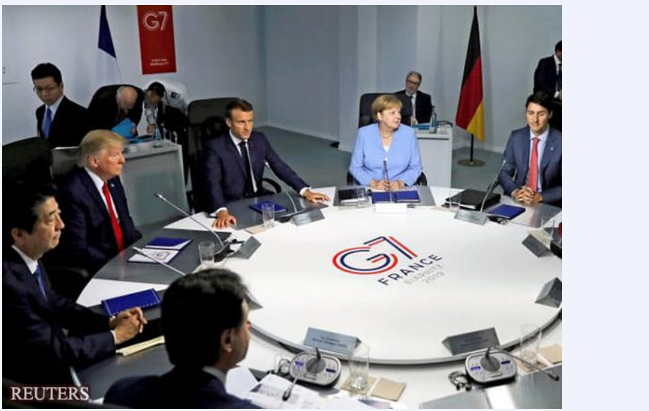
左起为日本首相安倍、美国总统特朗普、法国总统马克龙、德国总理默克尔、加拿大总理特鲁多（26 日，比亚里茨）

安倍提及 2018 年在加拿大召开的沙勒瓦(Charlevoix)峰会时的首脑宣言，提出“如果要发布简短的文件，或许可以根据以后的动态而增加新内容。应将主题锁定为这些”。截至去年的首脑宣言中存在的“与贸易保护主义战斗”的姿态没有出现，也没有提及欧洲重视的气候变化。