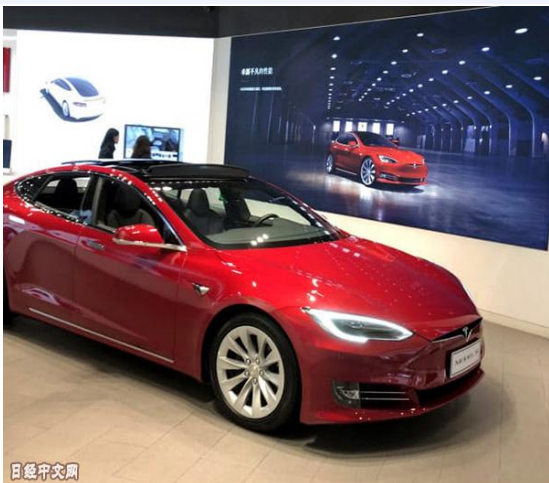
上海的特斯拉销售店

该公司目前在中国销量表现坚挺。1~6月销量约为2.1万辆，增至上年同期的2倍以上。英国调查公司LMC Automotive的分析师康军评价称，对特斯拉的新技术感兴趣的消费者增加。