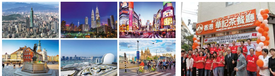
港人移民熱門地點